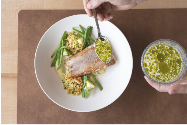
© Wolfgang Hummer Regionales Naturkulinarium für Genussmenschen